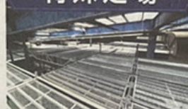
吊り足場から内部ステージまで、特殊な足場工事