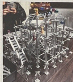
開発中のスマホアプリとボードゲーム