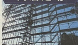
くさび・枠・鋼管足場すべてに対応した足場工事