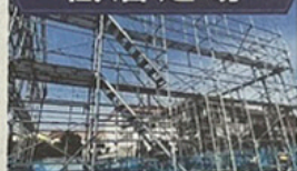
くさび足場を使った戸建住宅への足場工事